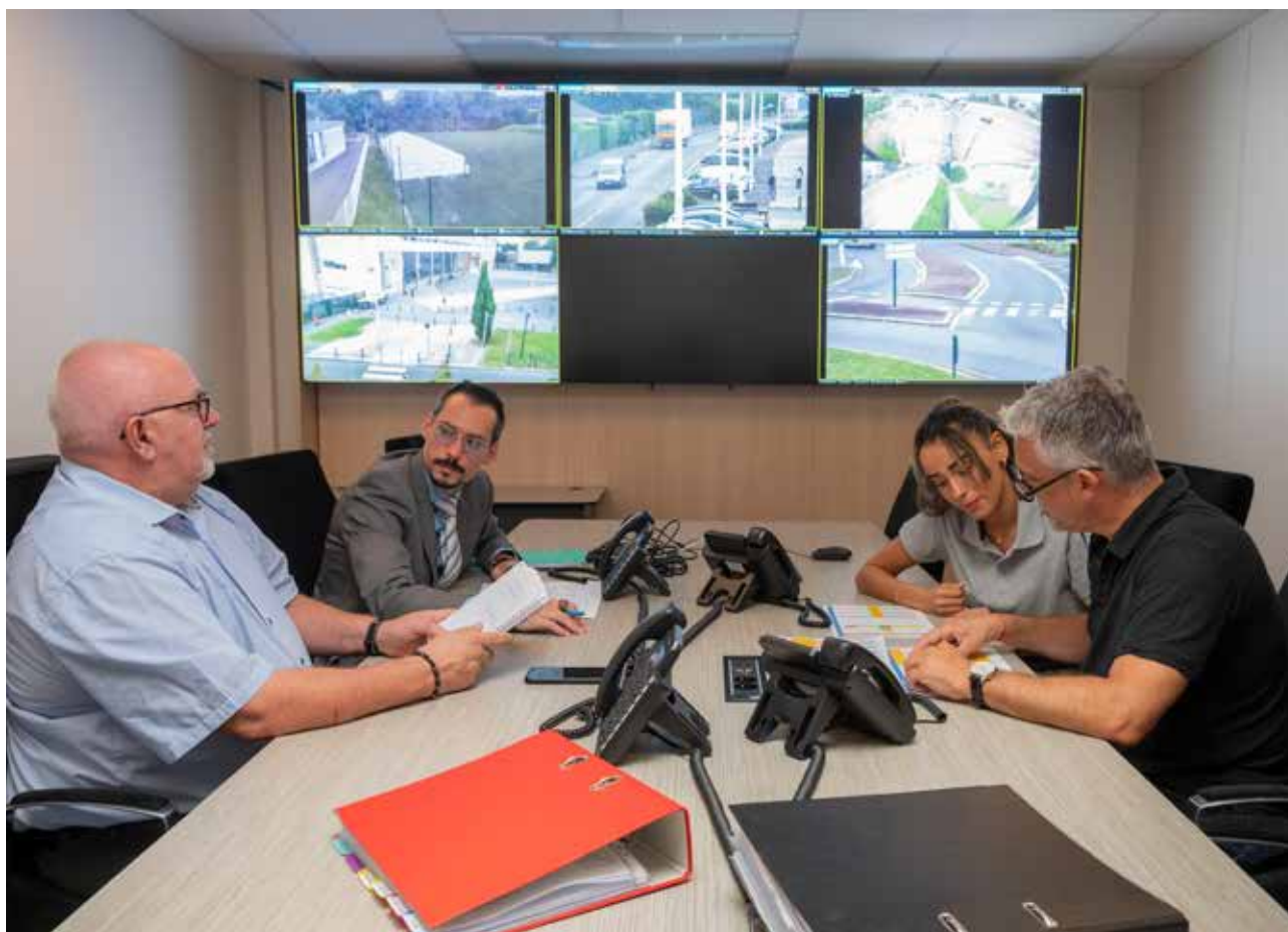
Salle de crise du CSUi

Suite aux émeutes, plusieurs centaines d'heures d'images ont été extraites pour les services d'enquête.